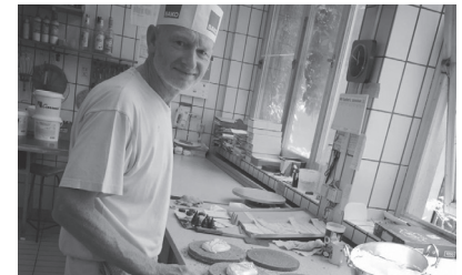
Der Konditormeister heute

Über die Pflege der alten Handwerkstradition hinaus stellen wir uns aber auch den Anforderungen der modernen Zeit. Die Café-Confiserie Urbann soll Treffpunkt der Generationen sein. Ein Ort der Information und Kommunikation oder schlicht eine Oase der Entspannung und Ruhe in einer sich immer schneller wandelnden Zeit.