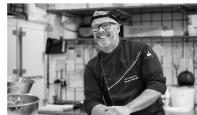
Der Konditormeister heute

Über die Pflege der alten Handwerkstradition hinaus stellen wir uns aber auch den Anforderungen der modernen Zeit. Die Café-Confiserie Urbann soll Treffpunkt der Generationen sein. Ein Ort der Information und Kommunikation oder schlicht eine Oase der Entspannung und Ruhe in einer sich immer schneller wandelnden Zeit.