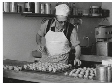
Der Konditormeister damals

Ein für Generationen von Schülern und Lehrern bis zu seiner Schließung im Jahre 2008 beliebter Treffpunkt für so manche „Freistunde“.