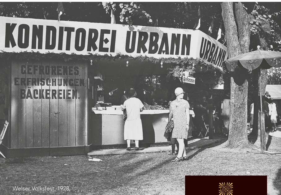
Welser Volksfest, 1928